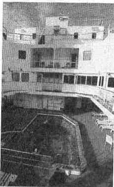
Schwimmen ohne Aussicht

Die Kräne sind stark genug, Motorboote, Traktoren und sogar Autos an Deck zu heben. Neuwagen werden von Tahiti auf die Marquesas gebracht, alte Fahrzeuge auf dem Rückweg zum Verkauf oder zum Verschrotten nach Tahiti mitgenommen. Sogar ein Sportflugzeug hatte das Schiff einmal an Bord, es gehörte dem belgischen Liedermacher Jacques Brel, der auf der Insel Hiva Oa seine letzten Lebensjahre verbrachte. Sein Grab liegt auf dem Friedhof des Dorfs Atuona, wenige Meter von der letzten Ruhestätte des Malers